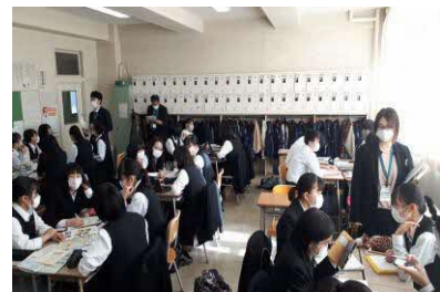
振興局・帯広市職員との協議の様子